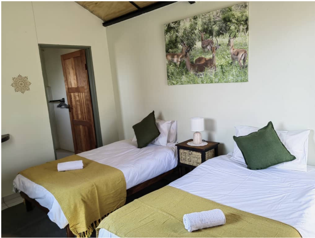
Eins der Schlafzimmer. Komfortabel, ordentlich und sauber.