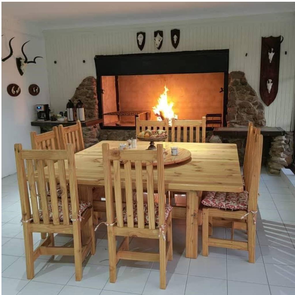
Wir garantieren Ihnen sehr gute Kost.