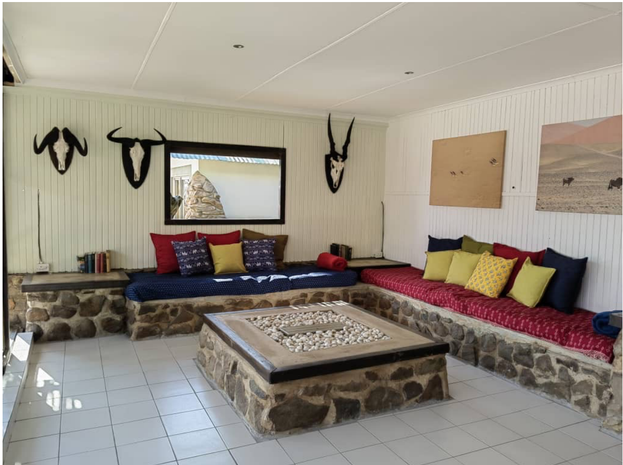
Hier können Sie in gemütlicher Runde Jägerlatein verzapfen!