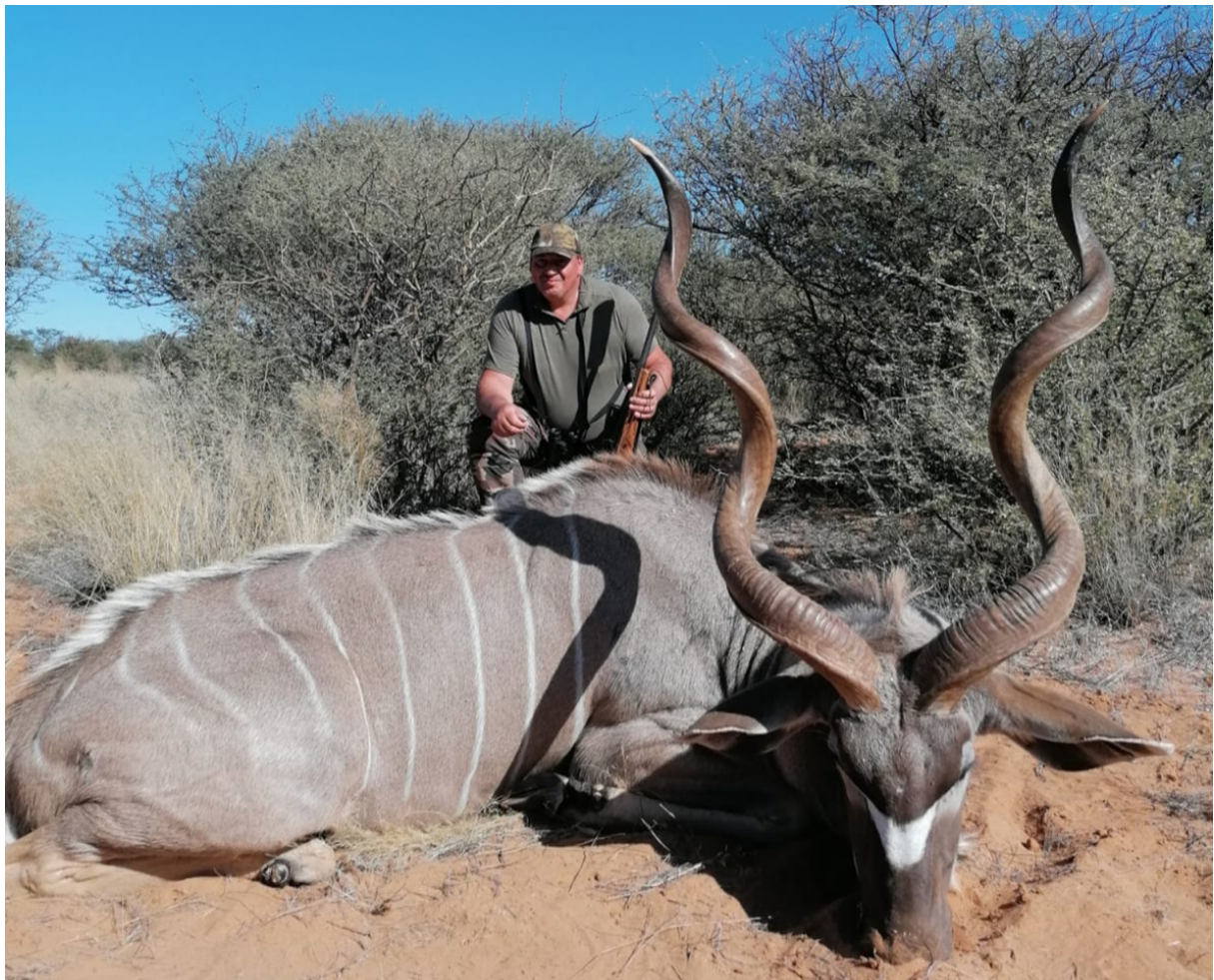
Starker Großer Kudu im typischen Biotop.