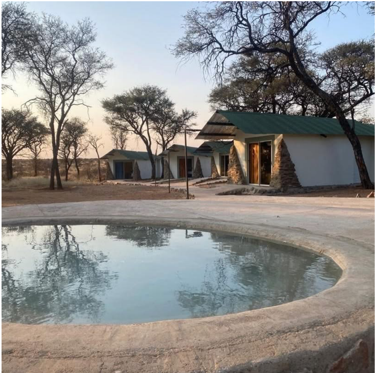
Haupt-Jagdcamp Omitara, 1 Autostunde von Windhoek. Die geräumigen Zelte sind mit Waschbecken und Duschen versehen und großen Betten.

Unser Jagdgebiet Omitara umfasst 9 Farmen und liegt ca. 1 Std. entfernt von Windhoek. Es ist insgesamt 400.000 ha freie Wildbahn und auf dieser unermesslich großen Jagdfläche hat unser Veranstalter das alleinige Jagdrecht. Natürlich gibt es Zäune, wie überall in Namibia. Aber sie sind nicht wildsicher, nur die Rinder können sie nicht überwinden. Das Gelände ist flach mit nur kleinen Hügeln, einer Landschaft wie im benachbarten Botswana. Oryxantilopen und Springböcke sind die am häufigsten vorkommenden Wildarten.