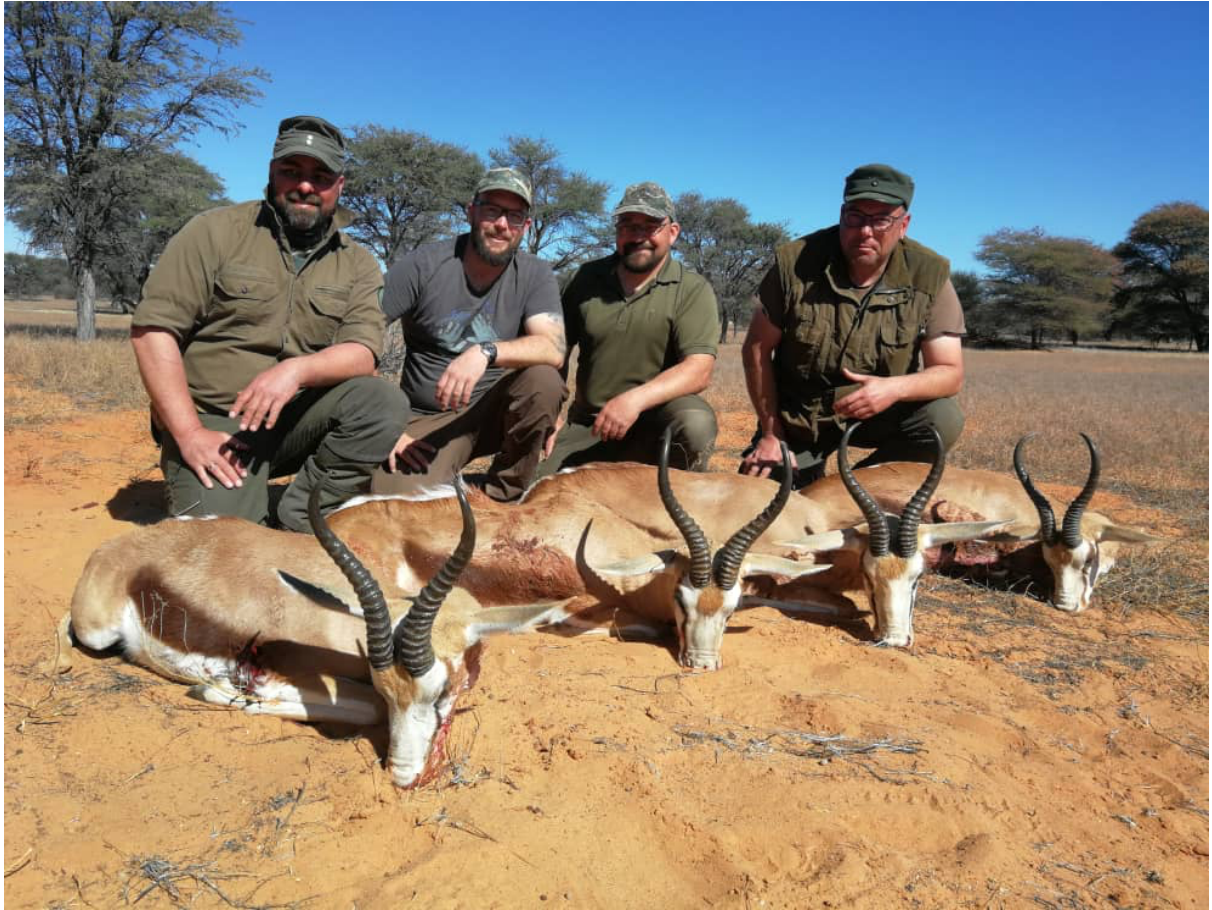
Vier glückliche Waidgenossen