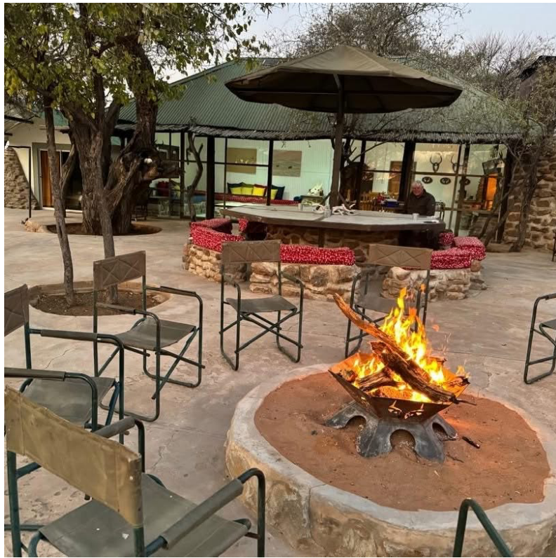
Haupthaus Omitara mit „geselligen“ Möbeln.