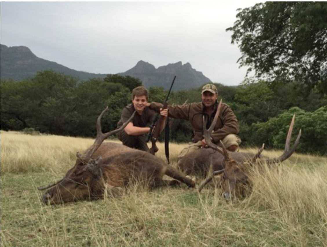
Wenn der Vater mit dem Sohne