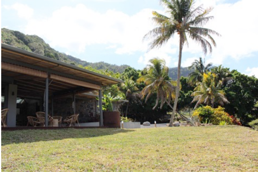
Die überdachte Terrasse