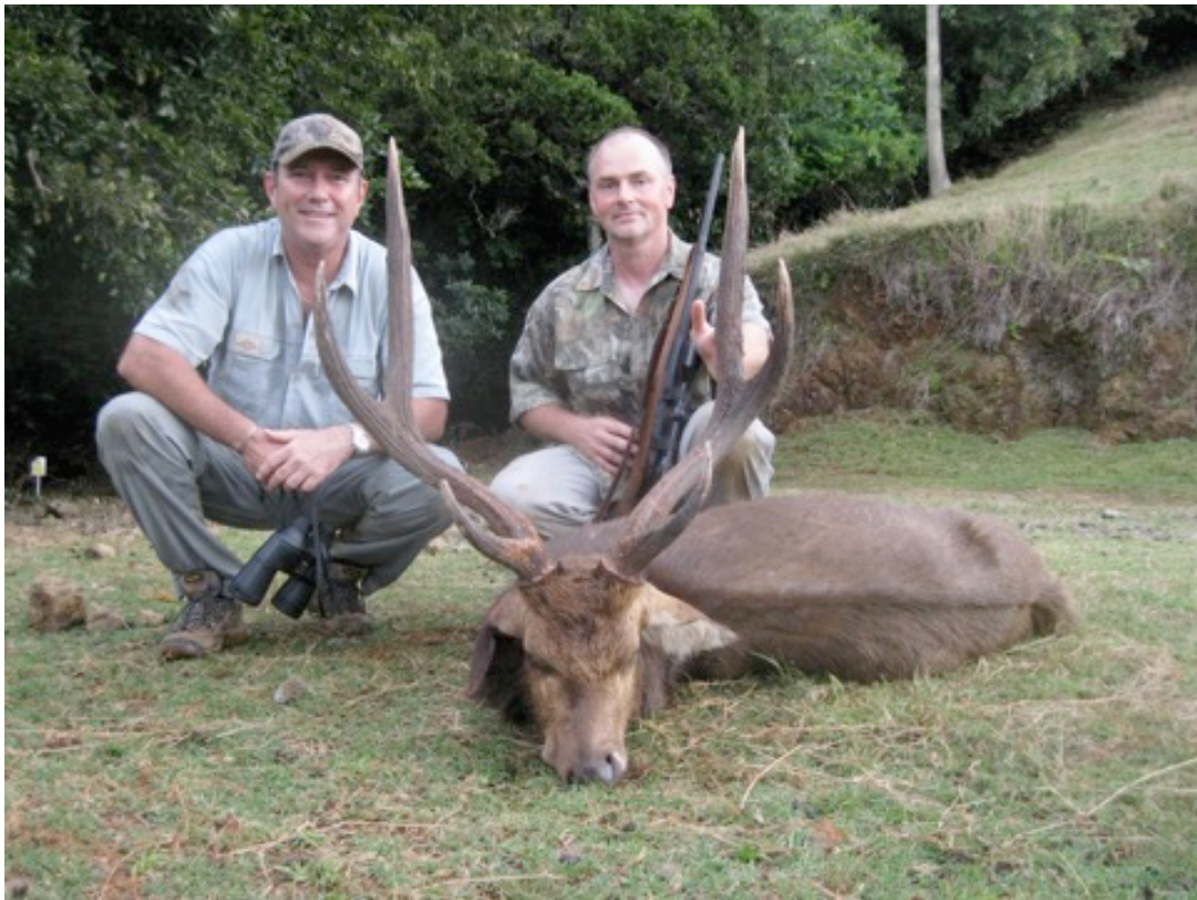
Links unser Jagdorganisator