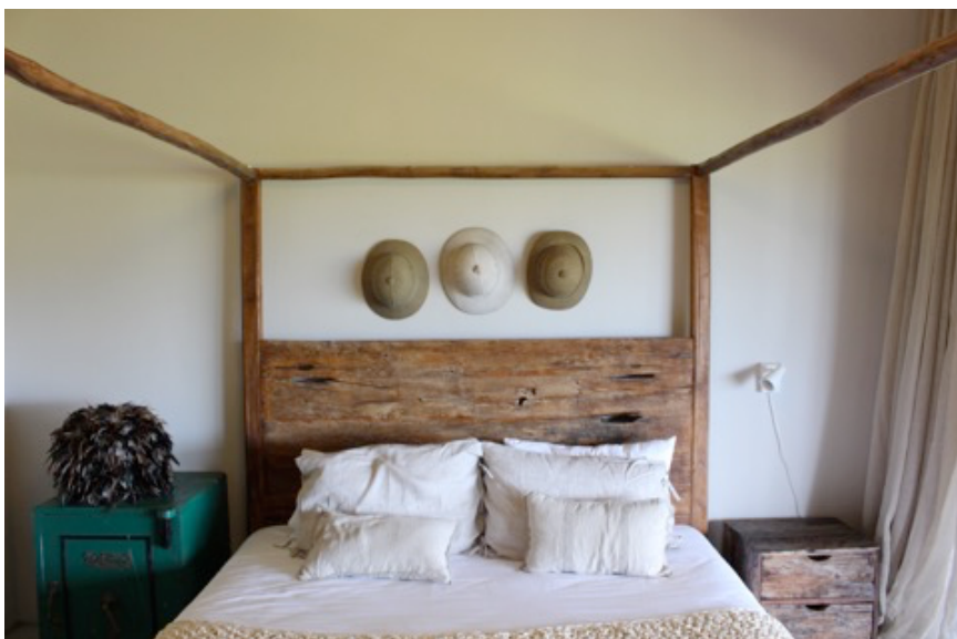
Es gibt 2 Schlafzimmer für 4 Personen