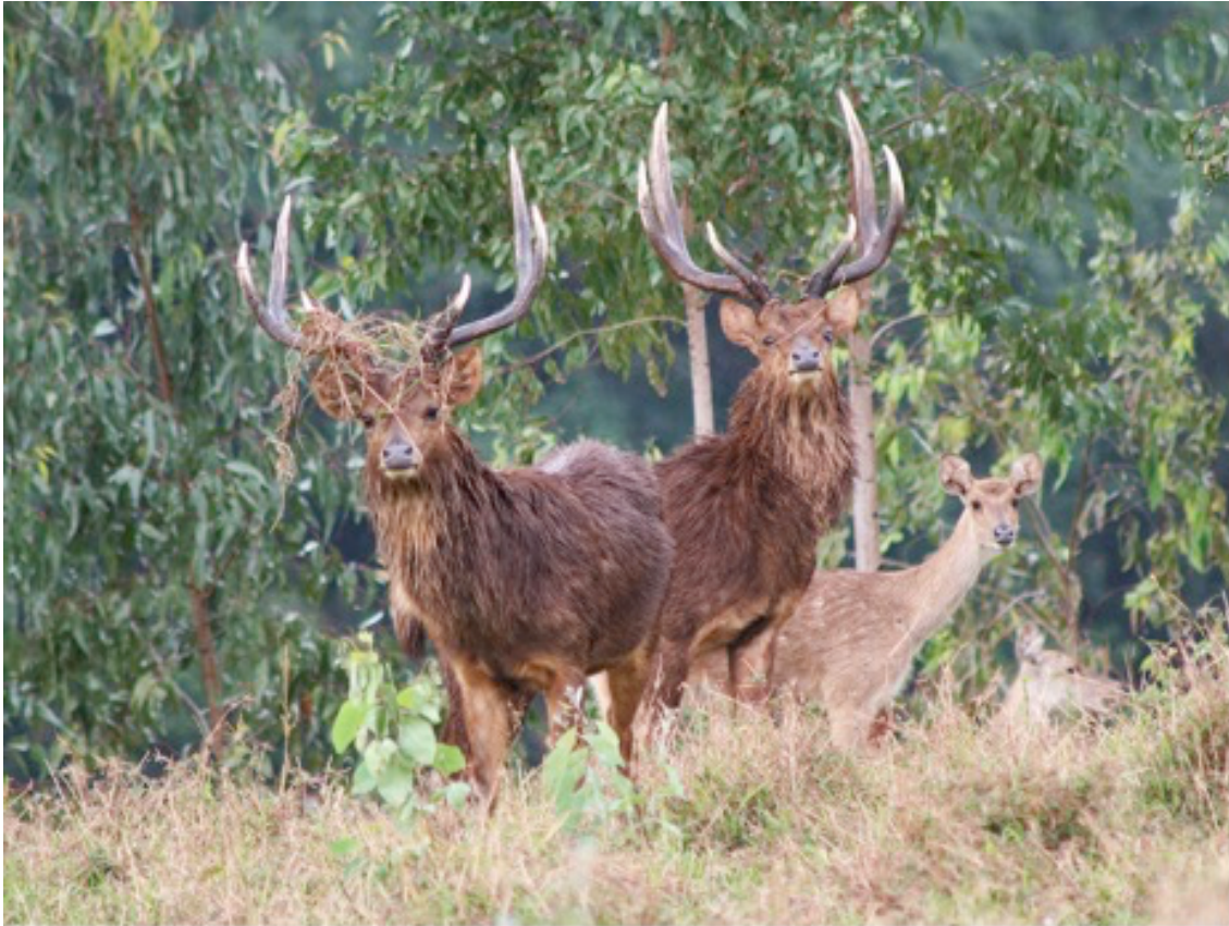
Rusas sind in der Brunft in jeder Hinsicht äußerst aktiv